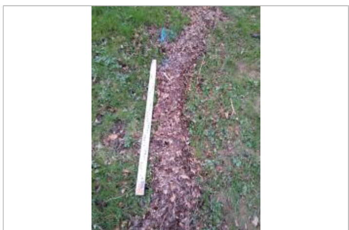
Dépôt sur la pelouse

GÉNÉRAL Code : 23_ORB22_R_693_1 Date de mise à jour : 26/04/2023 Auteur : SPC MO