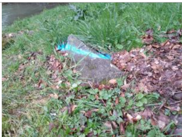
Dépôt en berge