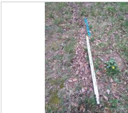
Dépôt en haut de berge