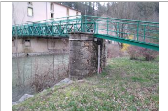
Pile de la passerelle

GÉOLOCALISATION Coordonnées WGS84 : X: 3.10112000 / Y: 43.75716980 Coordonnées RGF93 (Lambert 93) X: 708145 / Y: 6295354.99 Coordonnées RGF93 (ETRS89) : X: 3.10112 / Y: 43.7571698 Code Hydro: Y25-0400 Rive de référence: Droite