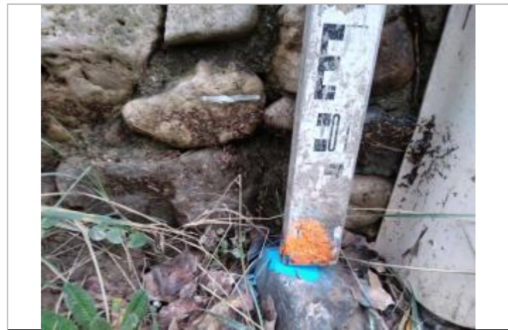
Trace sur la pile de passerelle

GÉNÉRAL Code : 23_ORB22_R_682_1 Date de mise à jour : 26/04/2023 Auteur : SPC MO