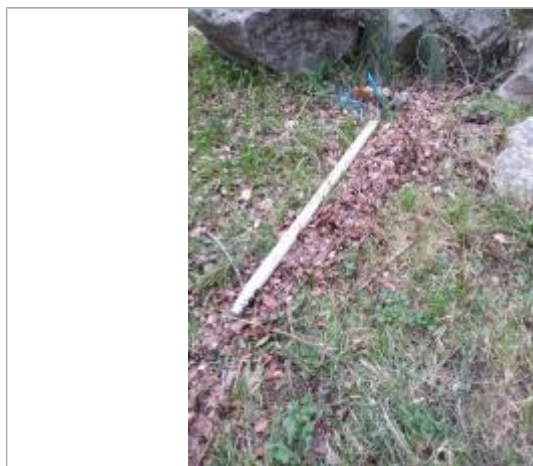
Dépôt en haut de berge