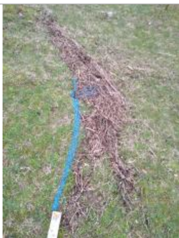
Dépôt en berge

Altitude calculée de l'eau (en m) : 295.51