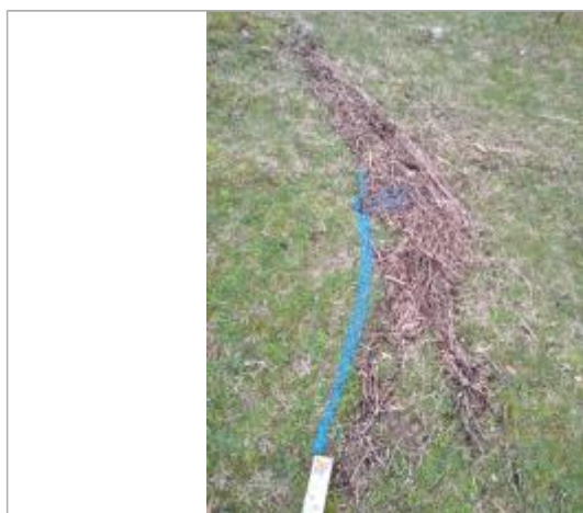
Dépôt en berge