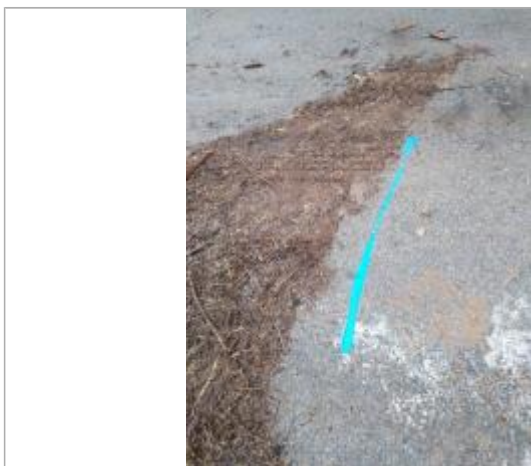
Dépôt sur la route