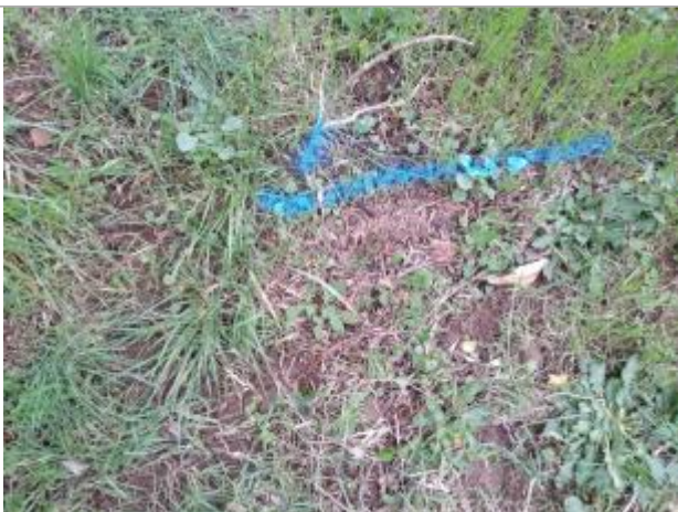
Dépôt en berge

Altitude calculée de l'eau (en m) : 278.92