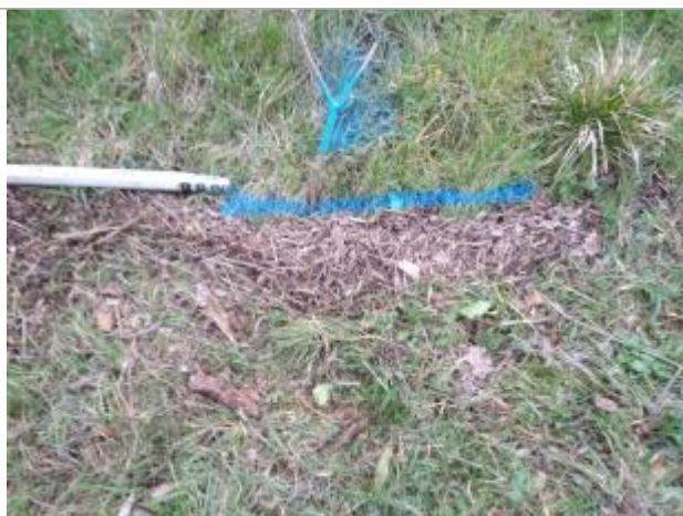
Dépôt en pied de talus

Altitude calculée de l'eau (en m) : 256.33