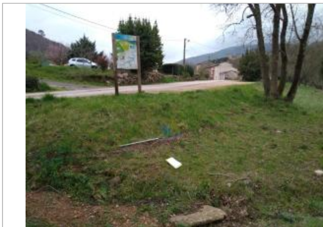
Talus de route

Coordonnées WGS84 : X: 3.16935470 / Y: 43.71041010