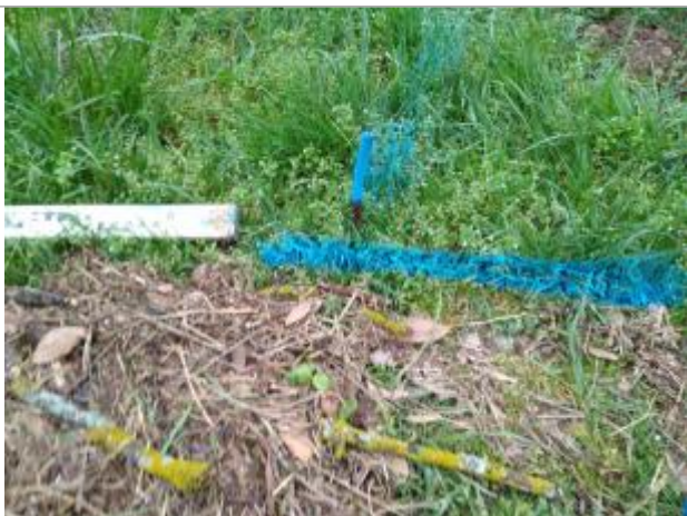
Dépôt sur le sentier

Altitude calculée de l'eau (en m) : 255.94