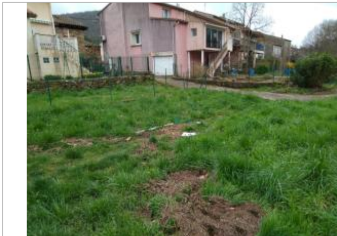
Sentier de berge