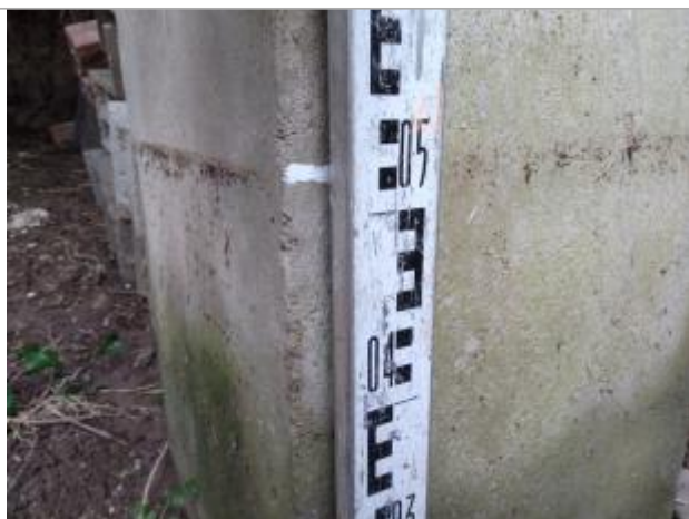
Trace sur la colonne

Altitude calculée de l'eau (en m) : 255.696