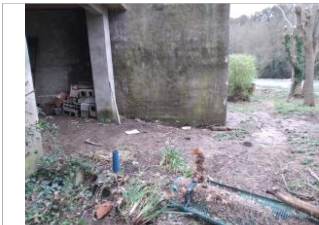
Colonne de terrasse

Coordonnées WGS84 : X: 3.16806800 / Y: 43.70861240