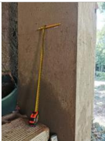
vue de la laisse sur le pillier de la Terrasse

Altitude calculée de l'eau (en m) : 257.24