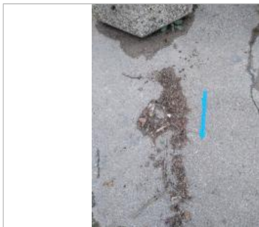
Dépôt sur la chaussée