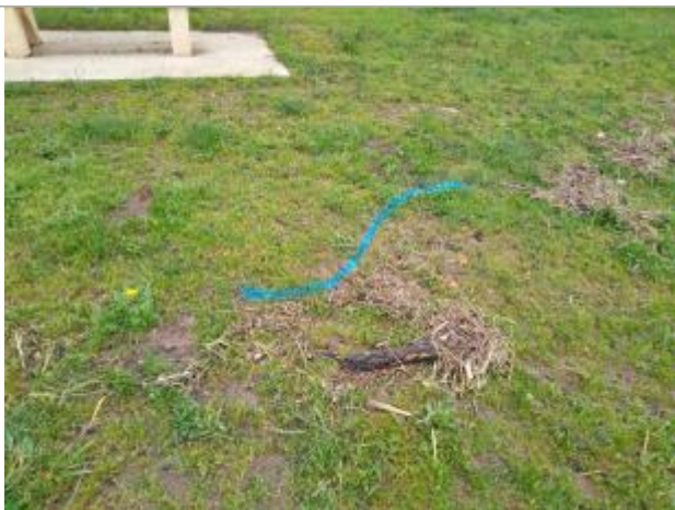
Dépôt au sol

Altitude calculée de l'eau (en m) : 249.78