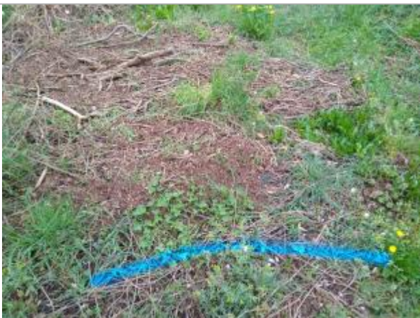
Dépôt au sol

Altitude calculée de l'eau (en m) : 249.19