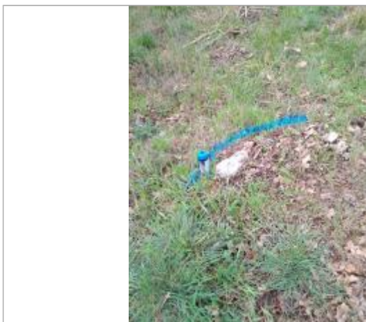
Dépôt dans l'herbe