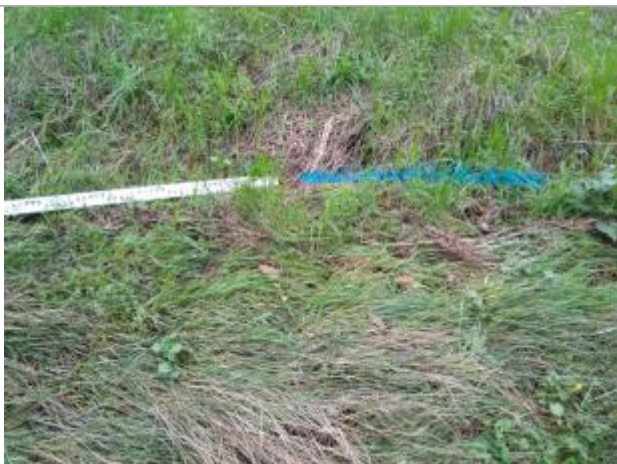
Dépôt contre le talus

Altitude calculée de l'eau (en m) : 242.26