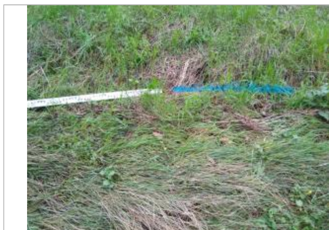
Dépôt contre le talus

Altitude calculée de l'eau (en m) : 242.26