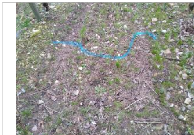
Dépôt au sol dans la vigne