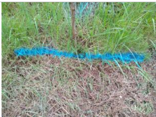
Dépôt dans l'herbe