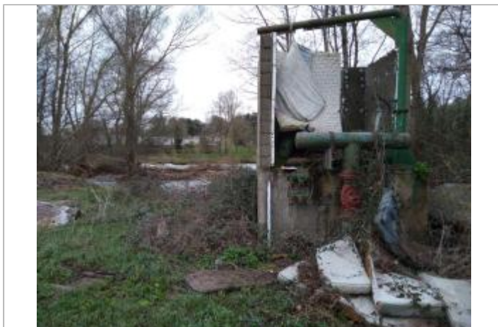
Station de pompage