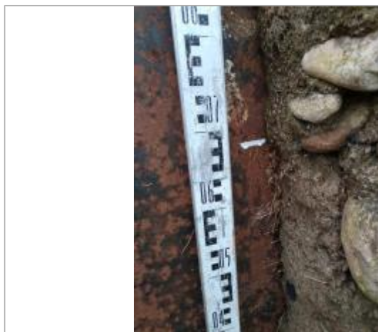
Trace sur le batardeau

Altitude calculée de l'eau (en m) : 234.744