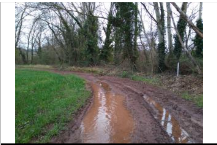
Taillis de ronces

GÉOLOCALISATION Coordonnées WGS84 : X: 3.17563460 / Y: 43.67016020 Coordonnées RGF93 (Lambert 93) X: 714168.5 / Y: 6285696 Coordonnées RGF93 (ETRS89) : X: 3.1756346 / Y: 43.6701602 Code Hydro: Y25-0400 Rive de référence: Gauche