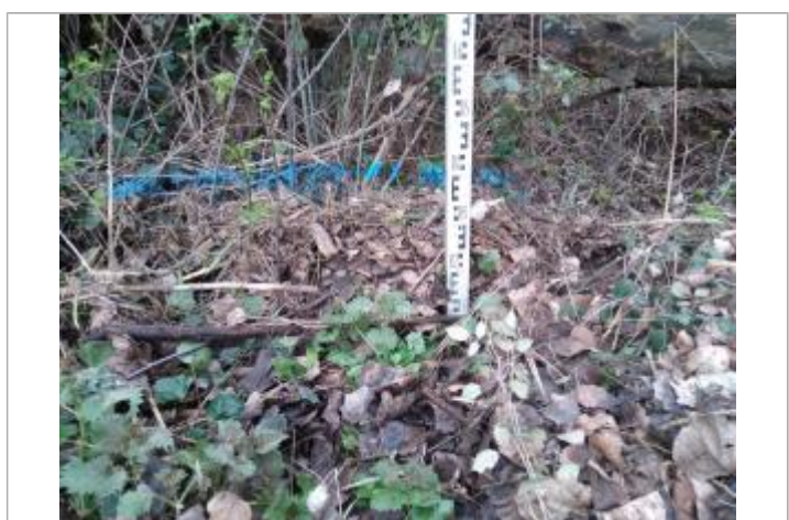
Dépôt dans les ronces

GÉNÉRAL Code : 23_ORB22_R_602_1 Date de mise à jour : 26/04/2023 Auteur : SPC MO