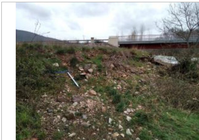
Haut de berge

Coordonnées WGS84 : X: 3.16336620 / Y: 43.66494240