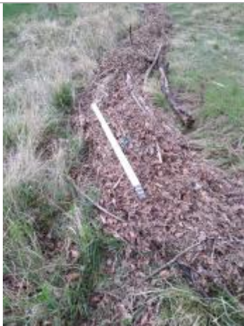
Dépôt dans l'herbe

Altitude calculée de l'eau (en m) : 227.11