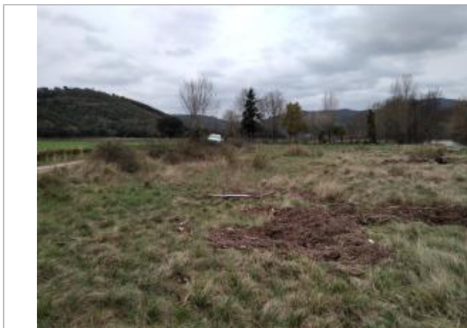
Dépôt dans l'herbe

Coordonnées WGS84 : X: 3.15992510 / Y: 43.66132130