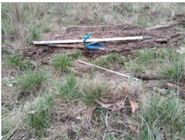
Dépôt dans l'herbe

Altitude calculée de l'eau (en m) : 225.05