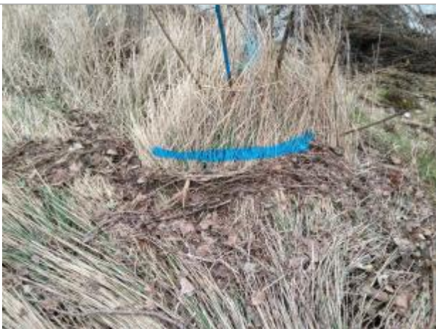
Dépôt dans l'herbe

Altitude calculée de l'eau (en m) : 220.45