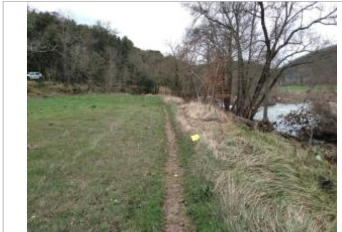
Haut de berge

Coordonnées WGS84 : X: 3.15347260 / Y: 43.65803730