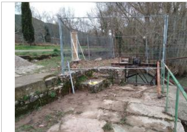
Muret sur l'ouvrage de prise d'eau