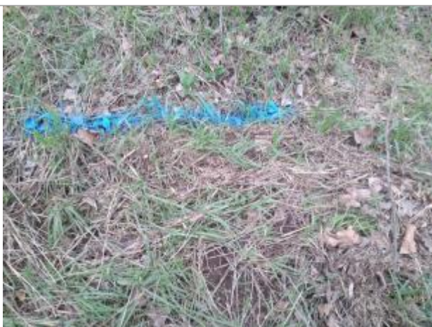
Dépôt en berge

Altitude calculée de l'eau (en m) : 210.28