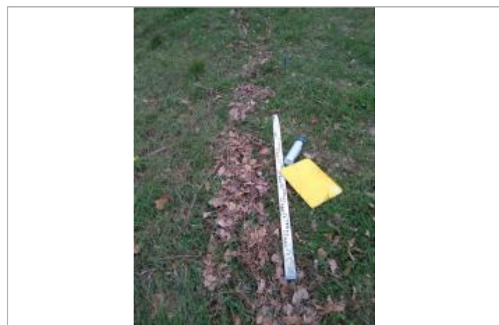
Dépôt en haut de berge

GÉNÉRAL Code : 23_ORB22_R_584_1 Date de mise à jour : 26/04/2023 Auteur : SPC MO