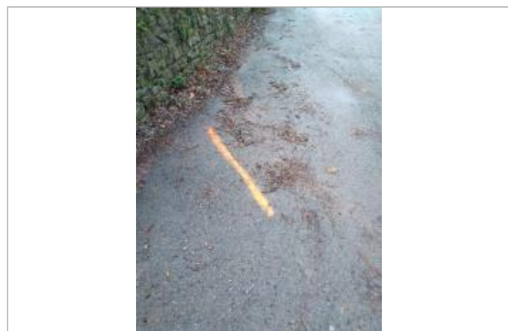
Dépôt sur la route