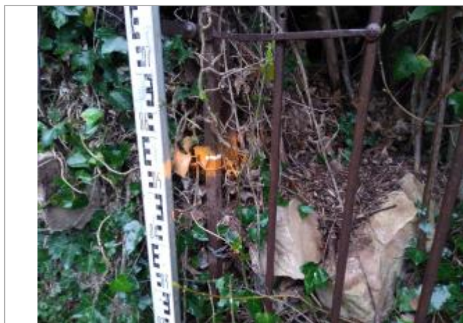
Dépôt contre la grille

Altitude calculée de l'eau (en m) : 202.158