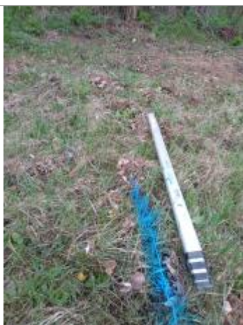
Dépôt dans l'herbe