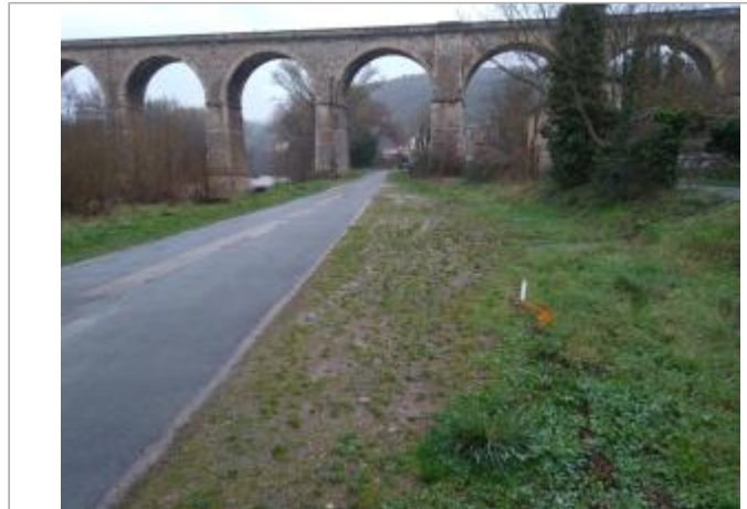
Bord de route

Coordonnées WGS84 : X: 3.16327940 / Y: 43.62097870