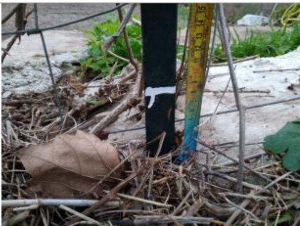
Débris végétaux dans le grillage

Altitude calculée de l'eau (en m) : 196.384