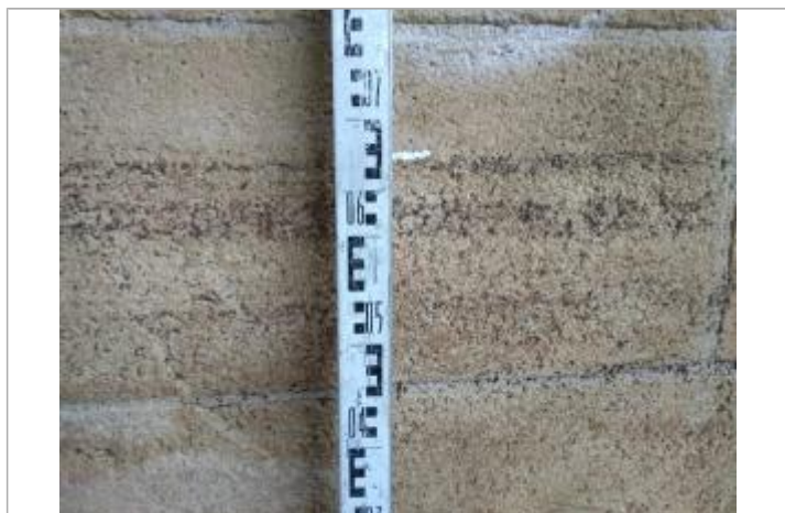
Trace sur la culée

Altitude calculée de l'eau (en m) : 195.791