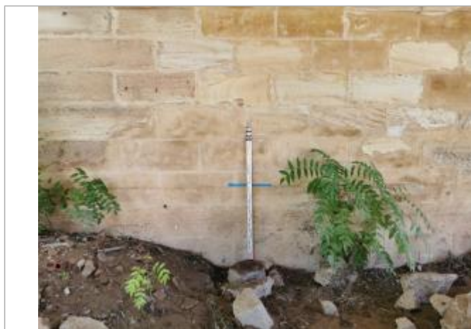
laisse sous le pont Neuf

Altitude calculée de l'eau (en m) : 195.93