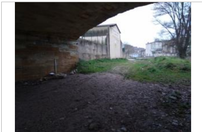
Culée de pont