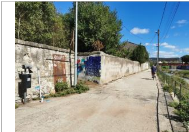
quai de la passerelle