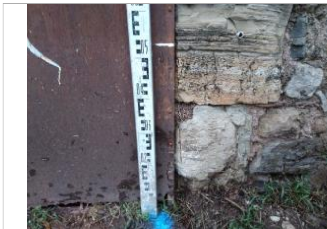
Trace sur la porte

Altitude calculée de l'eau (en m) : 193.59