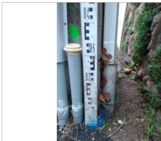
Débris végétaux accrochés au pylône