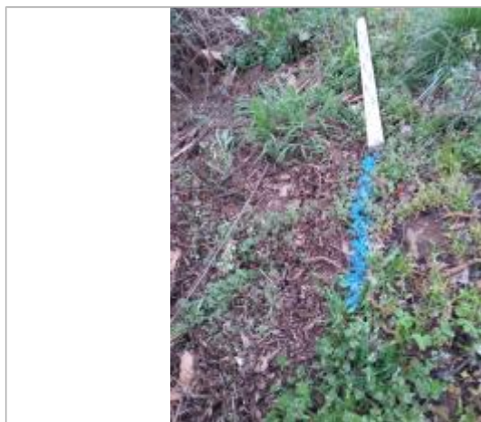
Dépôt en berge