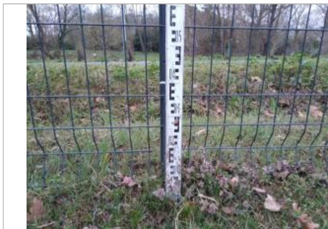
Trace dans le profilé

Altitude calculée de l'eau (en m) : 191.71