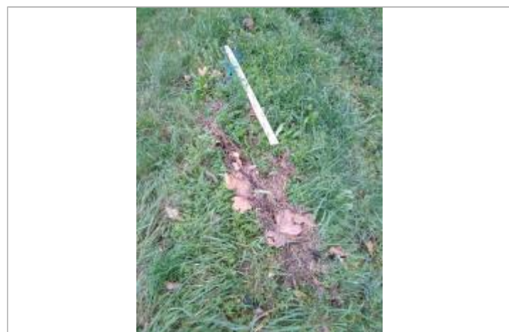
Dépôt contre le talus