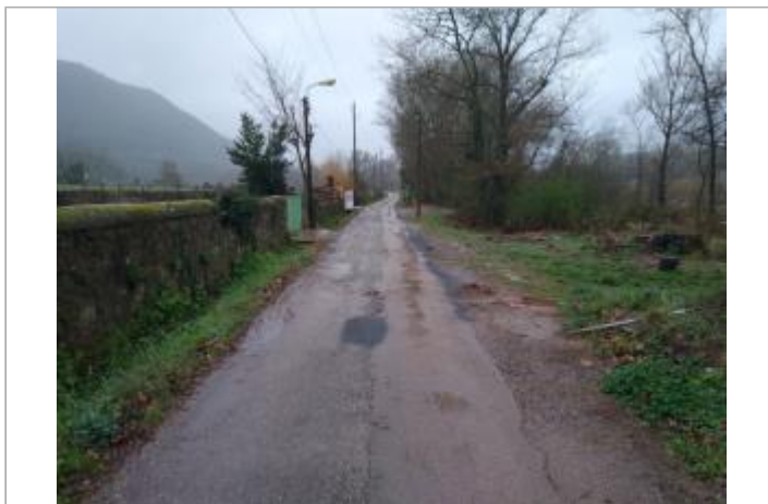
Bord de route