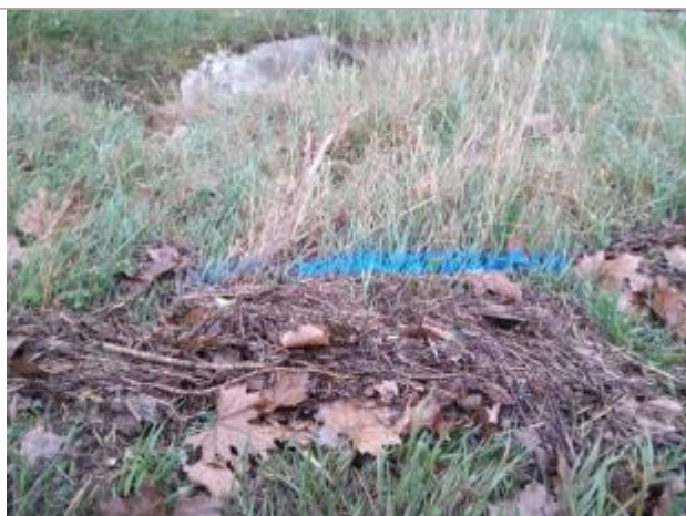
Dépôt au sol