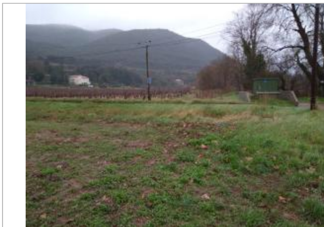
Bordure de champ

Coordonnées WGS84 : X: 3.14941100 / Y: 43.60138360