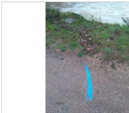
Dépôt au sol