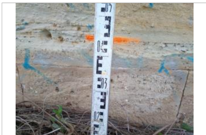
Trace sous l'arche

Code : 23_ORB22_R_510_1 Date de mise à jour : Auteur : SPC MO 26/04/2023