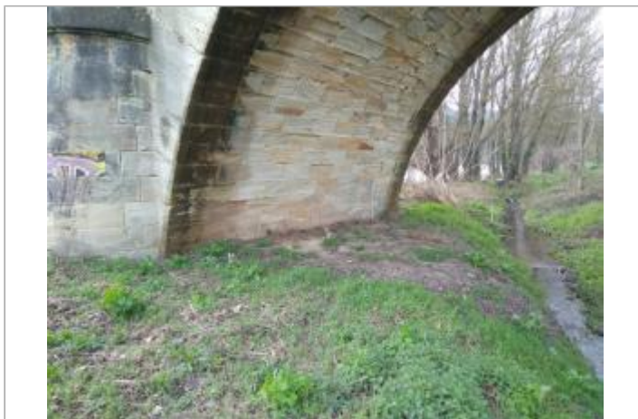
Arche du pont