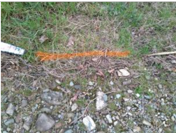
Dépôt sur le chemin

Altitude calculée de l'eau (en m) : 177.88