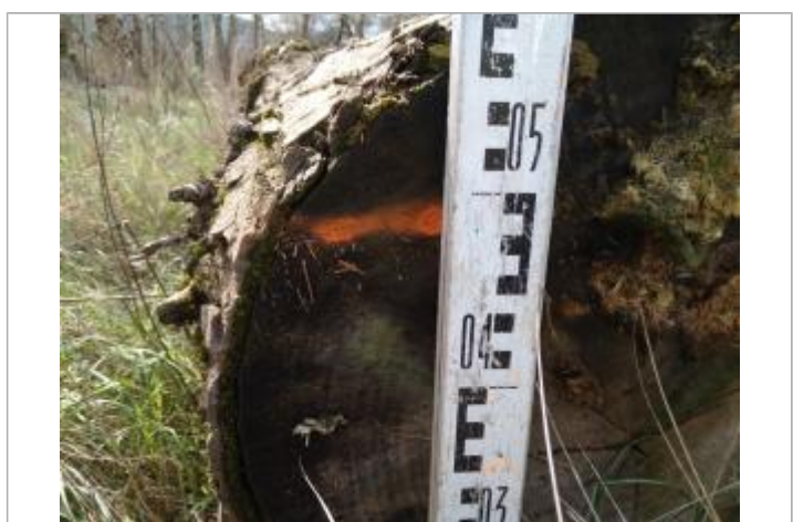
Trace sur une bille de bois

GÉNÉRAL Code : 23_ORB22_R_503_1 Date de mise à jour : 26/04/2023 Auteur : SPC MO