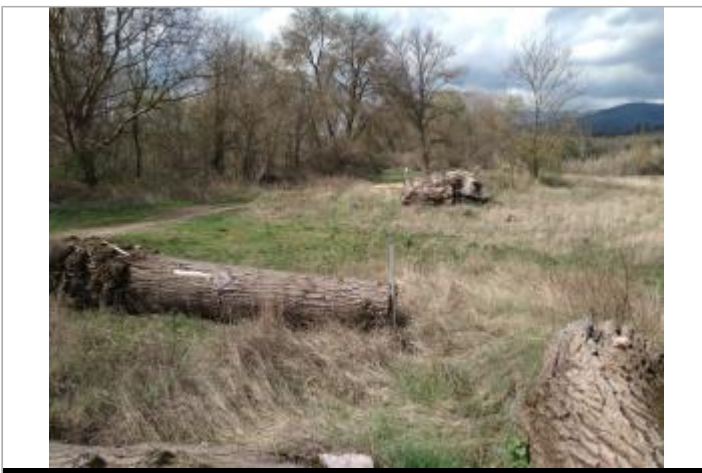
Bille de peuplier

GÉOLOCALISATION Coordonnées WGS84 : X: 3.10628920 / Y: 43.58786590 Coordonnées RGF93 (Lambert 93) X: 708586.7 / Y: 6276539.99 Coordonnées RGF93 (ETRS89) : X: 3.1062892 / Y: 43.5878659 Code Hydro: Y25-0400 Rive de référence: Droite