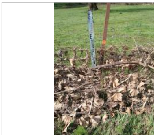
Débris végétaux dans le grillage