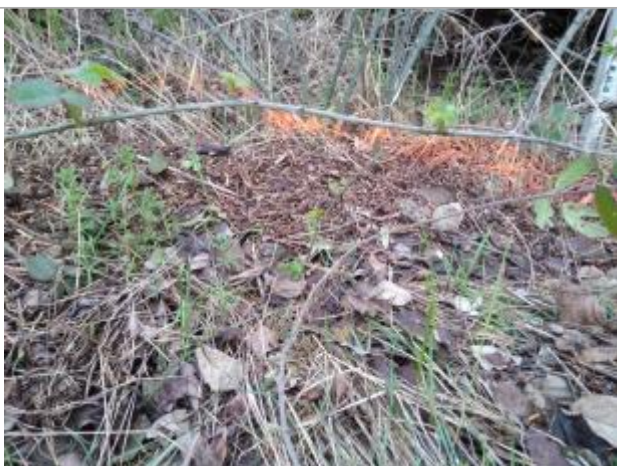
Dépôt dans les ronces