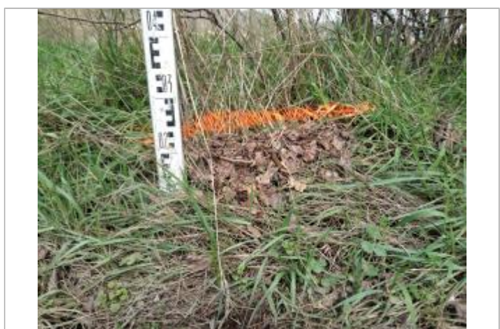
Dépôt dans l'herbe

GÉNÉRAL Code : 23_ORB22_R_491_1 Date de mise à jour : 26/04/2023 Auteur : SPC MO