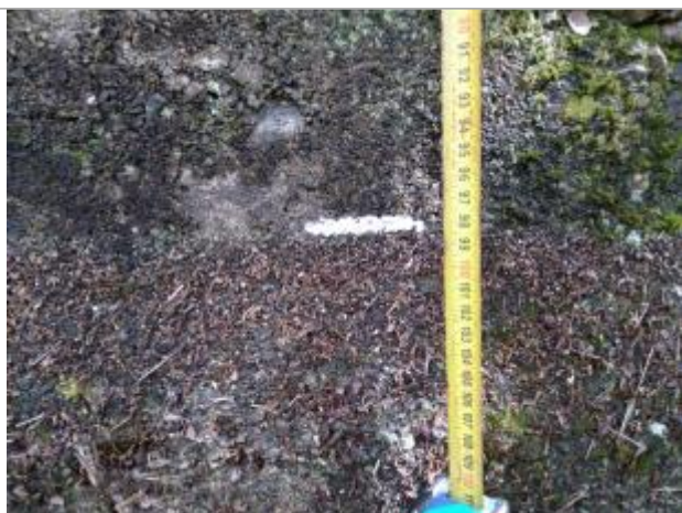
Trace sur la digue