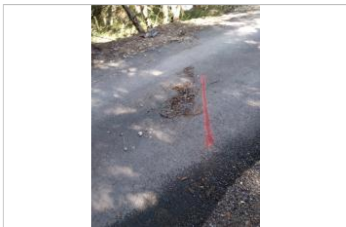
Dépôt sur la chaussée

Altitude calculée de l'eau (en m) : 115.437