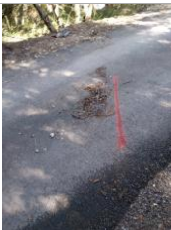
Dépôt sur la chaussée